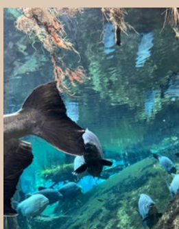
EN PORTADA: Piso del Amazonas, en el Museo de Ciencias de Barcelona.